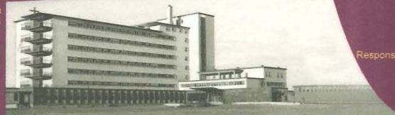
L'Hôtel-Dieu Notre-Dame de l'Assomption ouvre ses portes le 11 juin 1955