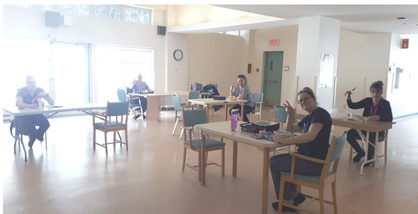
CHSLD des Pensées, Jonquière